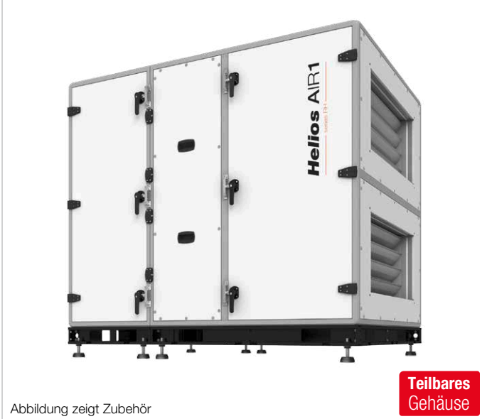
Abbildung zeigt Zubehör